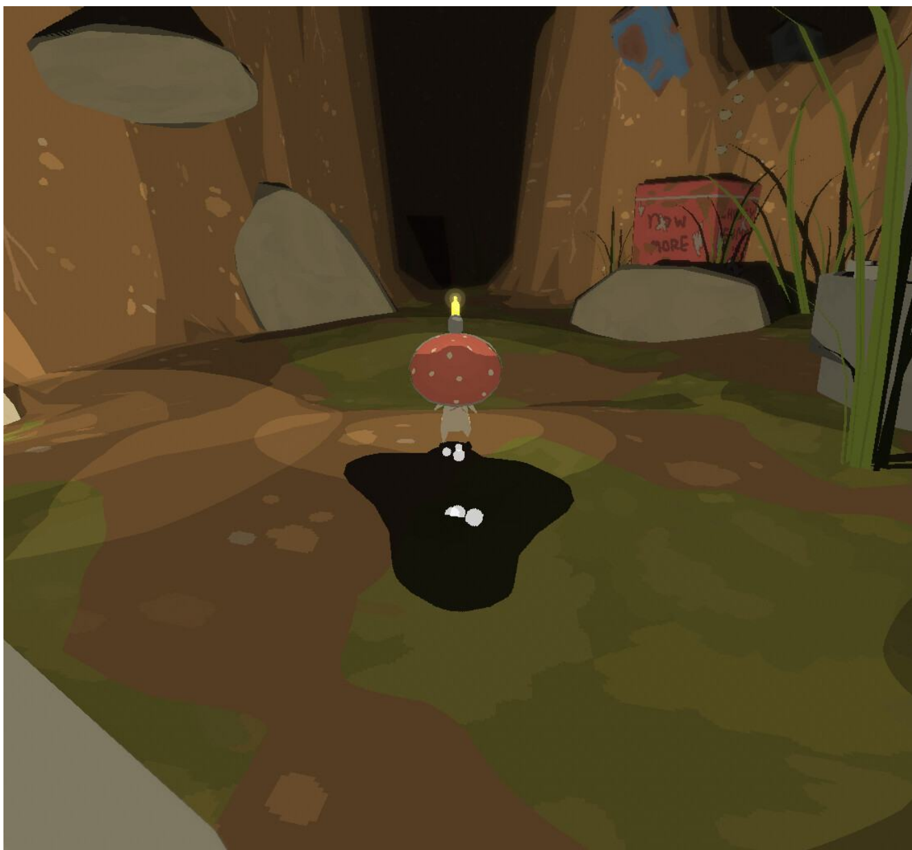
Zrzut ekranu z gry, Steam.